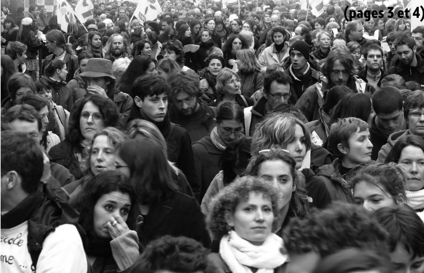
20 novembre : 220 000 manifestants contre Darcos.