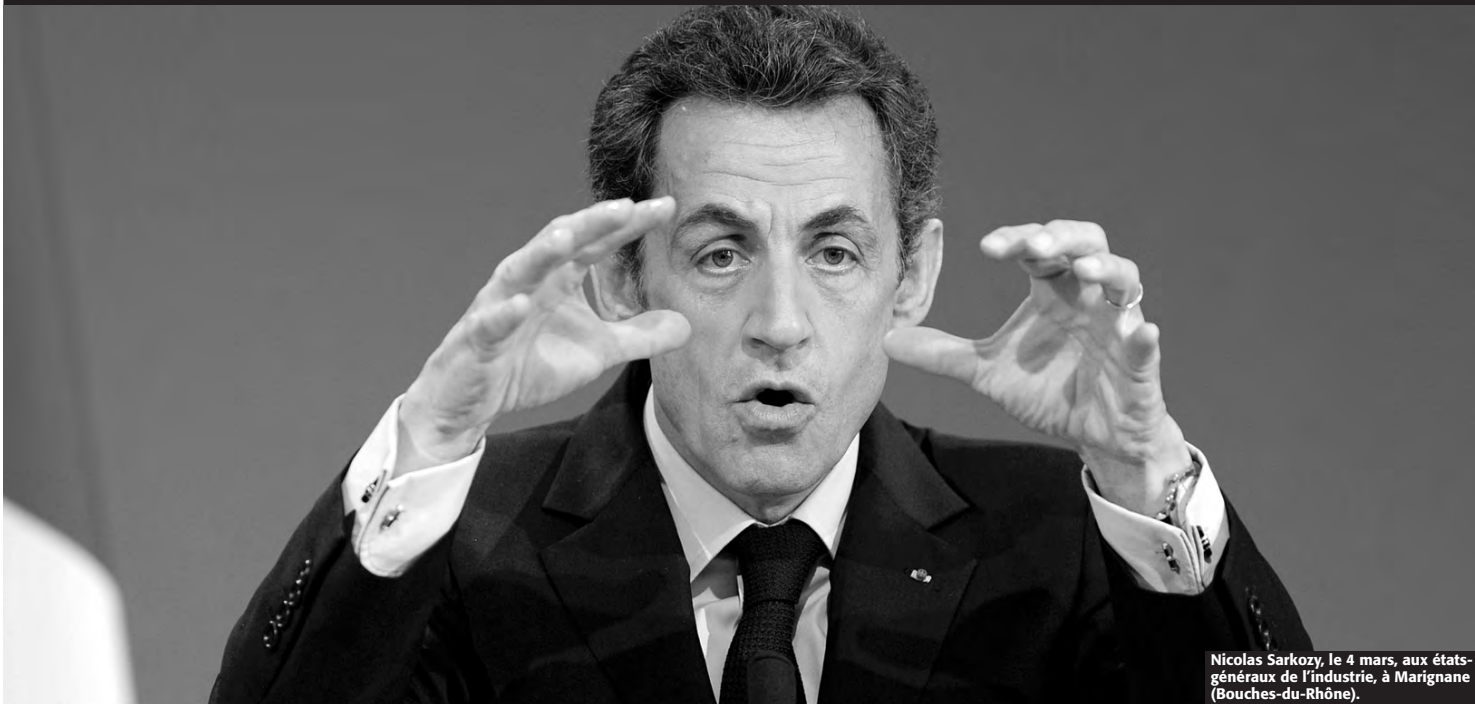
Nicolas Sarkozy, le 4 mars, aux états-généraux de l'industrie, à Marignane (Bouches-du-Rhône).