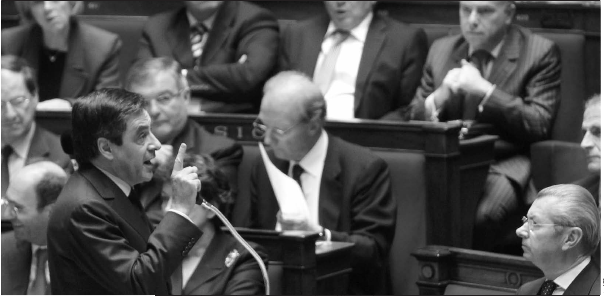
Le Premier ministre, François Fillon, le 23 mars 2010, à l'Assemblée nationale.