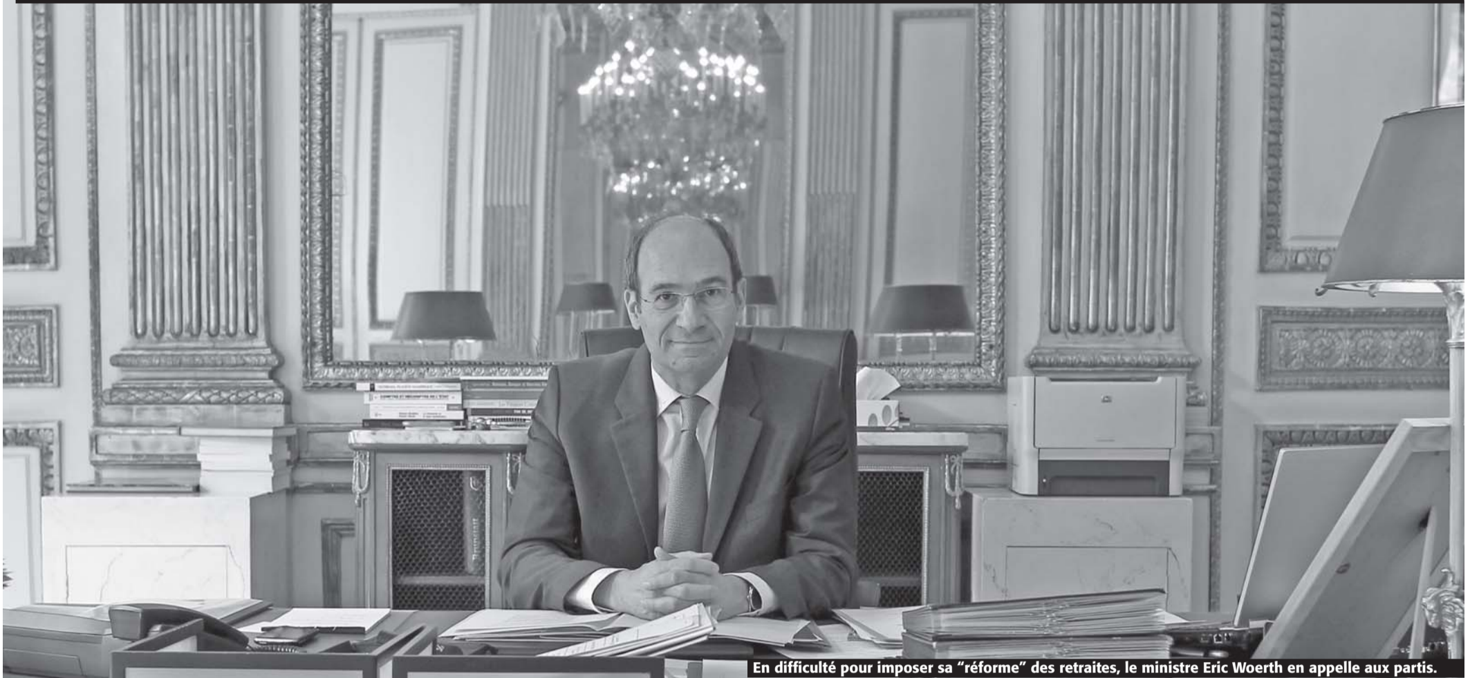
En difficulté pour imposer sa "réforme" des retraites, le ministre Eric Woerth en appelle aux partis.